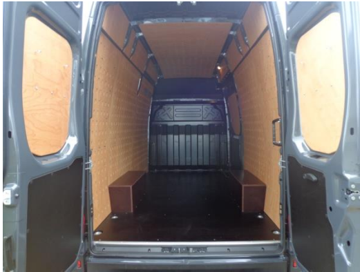
Transporter mit Superhochdach