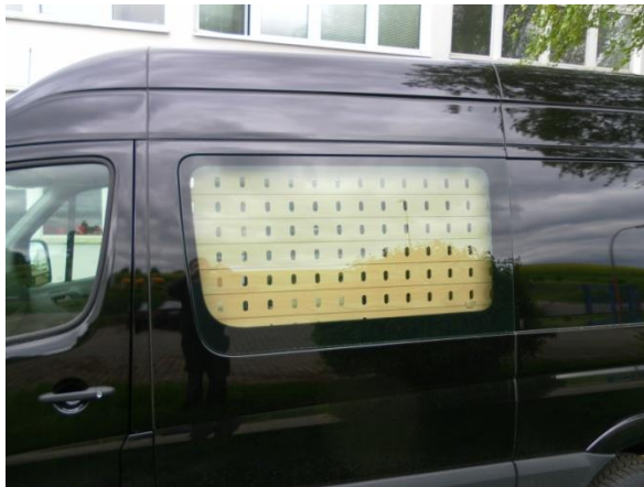
Auch über das Seitenfenster Installierbar