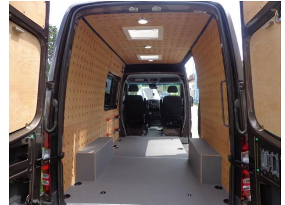
Seiten-, Dachfenster und Lichtsysteme können mühelos mit dem CargoClips Grundsystem kombiniert werden