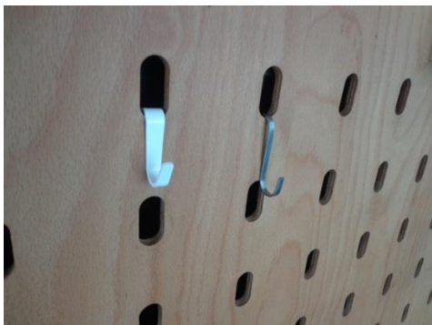
Handelsübliche Hacken können in das Lochsystem eingehängt werden.