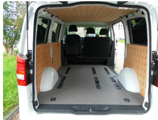
Passt auch perfekt für Minivans wie den Vito, VW-Transporter...