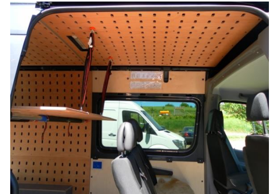
Es können auch nur Teilbereiche im Laderaum verkleidet werden