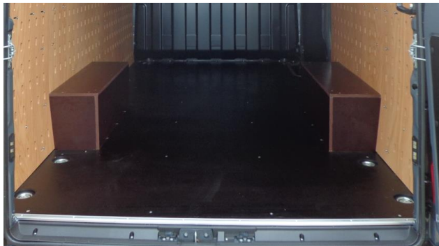
Radkasten in der Optik des Fußbodens wählbar