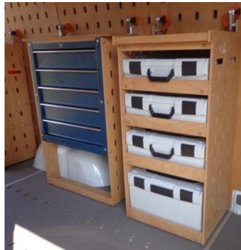
Werkstattregal mit Schubladenregal kombinierbar