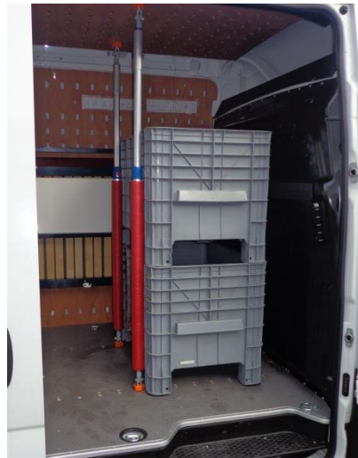
Die CargoClips Sperrstange verhindert das Verrutschen der Transportboxen.