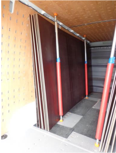
Große Platten werden optimal gesichert