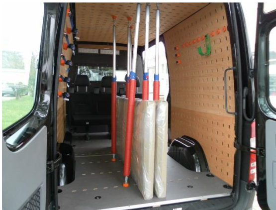
Große Platten, Fenster und Türen können sicher transportiert werden und rechts und links der Ware kann zusätzlich Werkzeug verstaut werden.