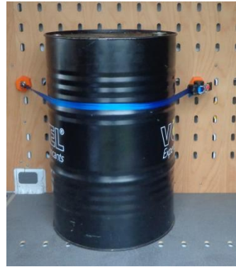
Gurtbox in Kombination mit dem Sperrbolzen