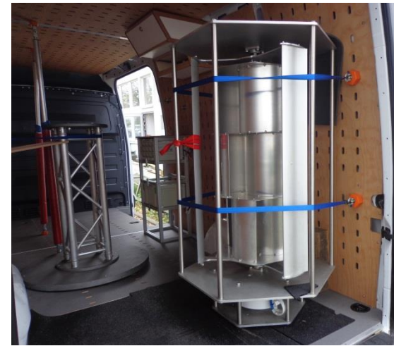
Sperrige Teile sind in Sekunden gesichert.