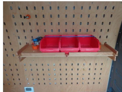
Mit der Gurtbox können Transportgut und Boxen auf dem Klappregal und Doppeltem Boden zusätzlich gegen das Verrutschen gesichert werden