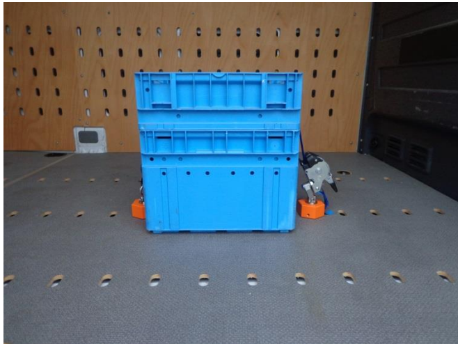
Auch in dem CargoClips Boden zu verwenden